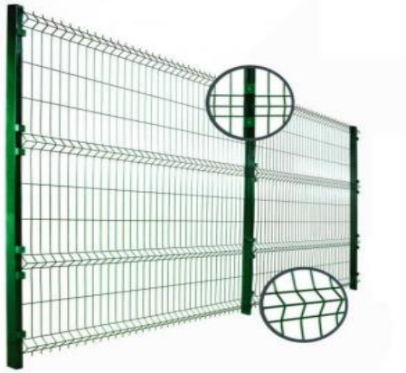
Figura 2 - Modelo do Gradil

(62) 3238-2000 | www.oabgo.org.br | oabnet@oabgo.org.br